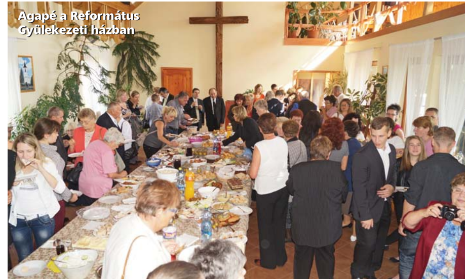
Agapé a Református Gyülekezeti házban

Montenegróban, Budván 10 napot. Voltunk Horvátországban egy másik utazás során 10 napot Omisban. Voltunk Kétszer Erdélyben, kétszer Kárpátalján a Testvér Gyülekezetünkénél, Mezőváriban. Voltunk Felvidéken Gömörben, nemzetközi cserkésztalálkozón egy hetet.